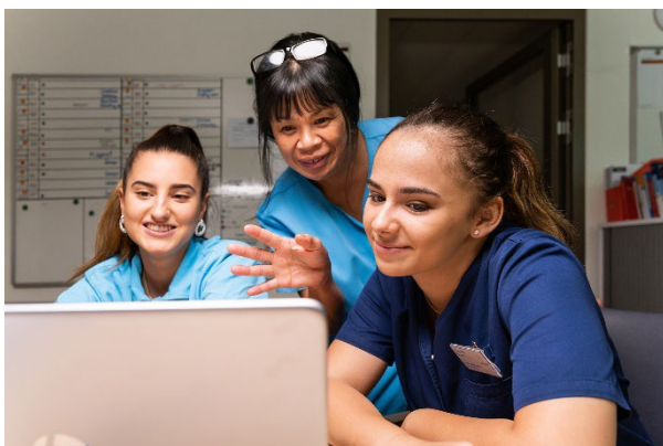
Bildbeschriftung: Mitarbeiterinnen von Solina im Stationszimmer

Wir danken unseren engagierten Mitarbeiterinnen und Mitarbeitern von ganzem Herzen für ihren unermüdeten Einsatz zum Wohle unserer Bewohnerinnen und Bewohner.